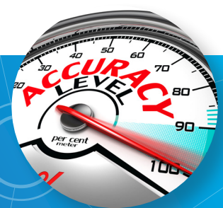
校正による正確な測定