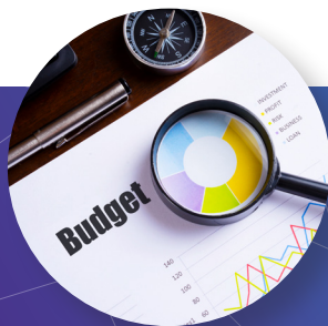
予測可能で低コストのメンテナンス

テスト機器のサービスプランを購入すると、総所有コストを最小に抑えながら、最大5年間のサービスコストを予算計上することができます。コストを予測可能にし、管理上の負担を軽減します。プランは、事後的なアラカルト購入よりも最大65%のコストを削減できるため、高いROIを実現し、また資産化できる場合が多いです。機器が最新で、最高の状態で動作していること、また作業者がアプリケーションを効果的に使用する方法を分かっていることを知ることで、安心感を得ることができます。