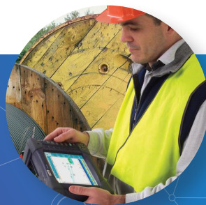
スタッフの生産性の最大化